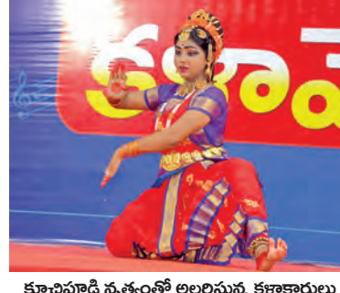
కూచిపూడి నృత్యంలో లలితా కళాకారులు