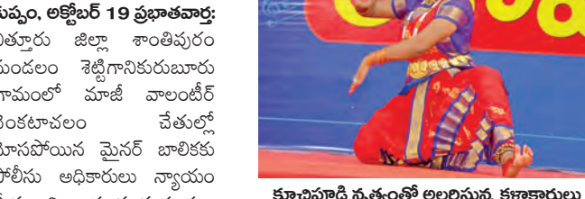
కూచిపూడి నృత్యంలో లలితా కళాకారులు